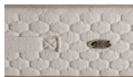
Fascia perimetrale trapuntata con maniglie e aeratori